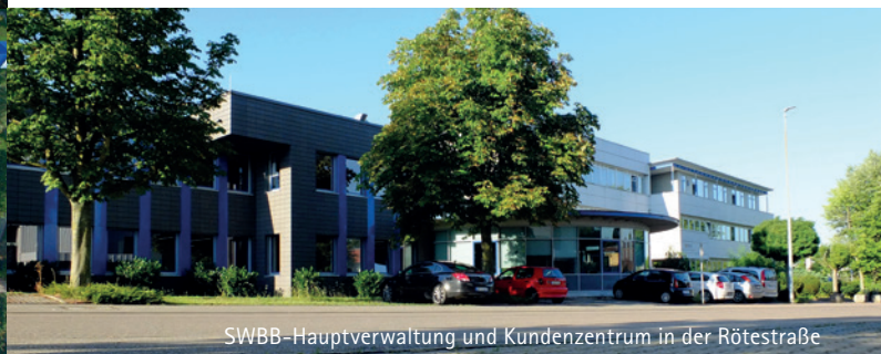
SWBB-Hauptverwaltung und Kundenzentrum in der Rötestraße