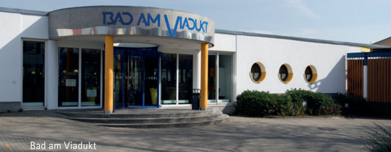
Bad am Viadukt