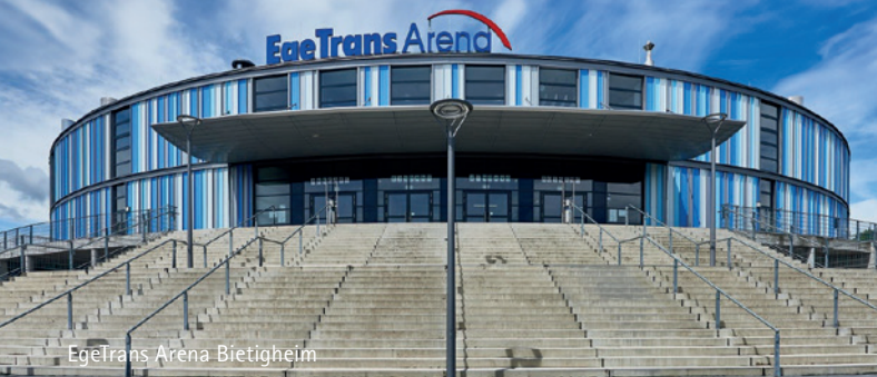
EgeTrans Arena Bietigheim